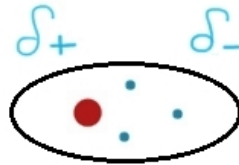
Distribuție inegală (asimetrică) care duce la formarea dipolului temporar

Atomii sau moleculele cu dipoli temporari interacționează datorită atracției electrostatice dintre dipolii temporari.