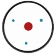
Distribuție regulată a electronilor

Datorită mișcării constante a electronilor în jurul nucleului, un atom sau o moleculă poate dezvolta un dipol temporar în momentul în care electronii sunt distribuiți inegal (sau asimetric) în stratul de valență.